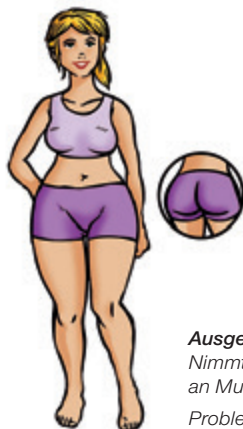
Ausgeprägter Körpertyp: Nimmt langsam an Muskulatur zu Problemzone: Po